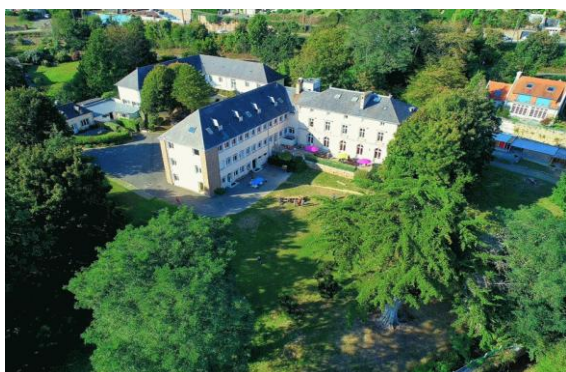
Le Centre le Hédraou Perros Guirec

Chaque participant(e) autorise expressément les organisateurs, du TCA, ainsi que ses ayants-droits tels que les partenaires et médias, sur tout support et par tout moyen, et par suite, à reproduire et à représenter, sans rémunération d'aucune sorte, ses nom, voix, image, et plus généralement sa prestation sportive et pour la durée la plus longue prévue par la loi, les règlements traités en vigueur, y compris pour les prolongations éventuelles qui pourraient être apportée à cette durée.